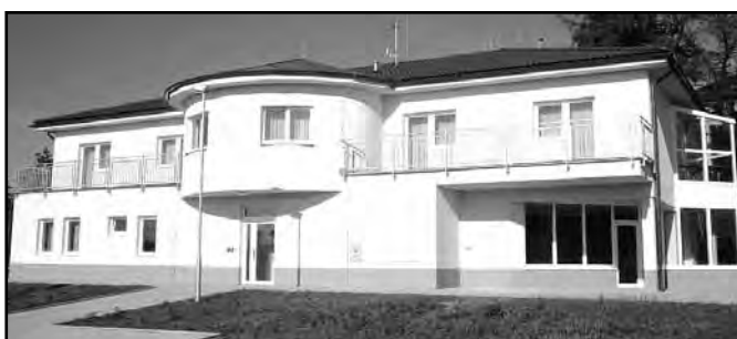
Centrum odborného výcviku a celoživotního vzdělávání.