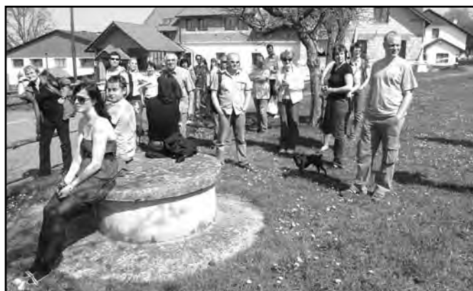
Z exkurze v rámci vzdělávacího kurzu „Venkovský cestovní ruch - příležitost pro nové podnikání“ (21. 4. 2011).

univerzity v Praze (PEF ČZU). Již od roku 2003 zajišťují tito partneři v Klatovech studium v bakalářském a navazujícím magisterském studijním programu - obor Veřejná správa a regionální rozvoj. Studium je organizováno jako kombinované (dříve se říkalo „dálkové“) a výuka probíhá o víkendech v Klatovech. Za posledních 8 let, co lze v Klatovech vysokou školu studovat, nastoupilo ke studiu kolem 1 330 studentů, z nichž zhruba dvě třetiny studium úspěšně ukončí a získají titul bakalář (Bc.) či inženýr (Ing.). V současné době u nás studuje v pěti ročních letech kolem 450 posluchačů. Pro následující akademický rok 2011/2012 je stále otevřen příjem přihlášek do bakalářského stupně studia. Příjem přihlášek do navazujícího magisterského studia byl již z důvodu naplnění kapacity ukončen.