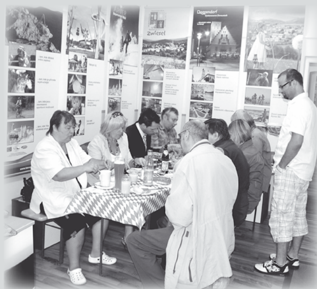
Snídaně s novináři v IC Plzeň. Tato akce se koná pravidelně a novináři jsou na ní informováni o činnosti, tipech na výlety a aktuálním dění u partnerů.

Cílem obou informačních center je propagovat destinaci Bavorský les – Šumava přímo v centrech krajských měst a v jednotlivých bavorských informačních střediscích jako komplexní a ucelenou turistickou destinaci. Turisté si svou dovolenou či výlet mohou naplánovat předem společně s námi – za naší asistence. Prezentována jsou zde jak jednotlivá bavorská města, obce, tak i mnohé zemské okresy Bavorského lesa, jednotlivá turistická zařízení, např. Stezka v korunách stromů v Neuschönau, nebo lyžařské areály v Mitterdorfu nebo na Velkém Javoru. Tato „bilingvní rodinka“ se v uplynulých měsících rozrostla i o další organizace, jako jsou např. Národní park Šumava, Město Klatovy, Město Waldkirchen či známé zábavní rodinné centrum Bayern-Park.