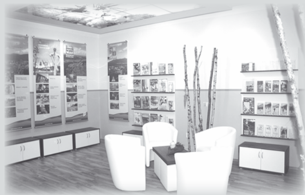
Interiér IC v Českých Budějovicích.

Informační centrum Bavorský les – Šumava Martinská 303/9, Plzeň Tel.: 377 322 145, info.plzen@bavorskelesy.cz