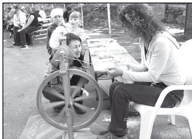
Z akce Prácheňska, z.s.p.o., na Práchni 13. května.

Místní akční skupina Pošumaví rozhodnutím své výkonné rady pro tento účel vyčlenila část prostředků z dotace Plzeňského kraje.