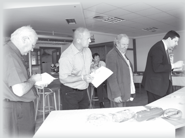
Hodnotitelská komise soutěže regionálních potravin.

I v letošním roce je Místní akční skupina Pošumaví, z.s.p.o., jedním z administrátorů soutěže malých a středních výrobců potravin Regionální potravina Plzeňského kraje 2011. Podle jednotné metodiky vydané Ministerstvem zemědělství České republiky se výrobci potravin v jednotlivých regionech ucházejí o vítězství v devíti kategoriích. V Plzeňském kraji se v letošním roce do soutěže přihlásilo 21 výrobců s 63 výrobky. Hodnotitelská komise složená ze zástupců ministerstva zemědělství, státní veterinární správy, státní zemědělské a potravinářské inspekce, agrární komory a Plzeňského kraje neměla jednoduché rozhodování, protože kvalita předložených výrobků byla vesměs na vysoké úrovni. Vyhlášení výsledků soutěže proběhne 17. 6. a 18. 6. 2011 na dvoře Krajského úřadu Plzeňského kraje na Festivalu regionální potraviny Plzeňského kraje za účasti nejvyšších představitelů kraje. Na této akci bude mít veřejnost poprvé možnost posoudit kvalitu výrobků. Po té bude následovat 10 oficiálních ochutnávek ve všech okresech Plzeňského kraje.