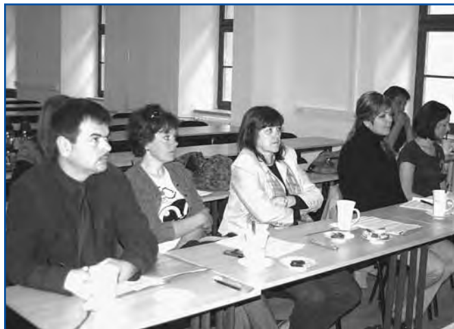
Ze školení výběrové komise 22. dubna.

Pro členy výběrové komise proběhl 22. 4. 2011 v Klatovech ve školící místnosti Úhlavy, o.p.s., seminář. Účastníci měli možnost se podrobně seznámit s novými fichemi a sjednotit své názory na výklad jednotlivých ustanovení při hodnocení projektů, které budou předloženy v 6. výzvě MAS Pošumaví. Zároveň došlo k vzájemnému seznámení členů výběrové komise, která byla nově zvolena na poslední valné hromadě sdružení. Poznatky z tohoto zasedání budou předávány na školeních žadatelů nebo je možno se s nimi seznámit v kanceláři MAS pošumaví ve Švihově.