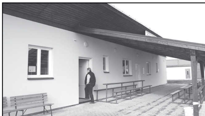
Jeden z úspěšných projektů z 3. výzvy: Obec Mochtín - Stavební úpravy kabin TJ Sokol Mochtín.

Nyní probíhá administrativní kontrola v MAS Pošumaví, na konci května zasedne výběrová komise MAS Pošumaví, která tyto projekty ohodnotí.