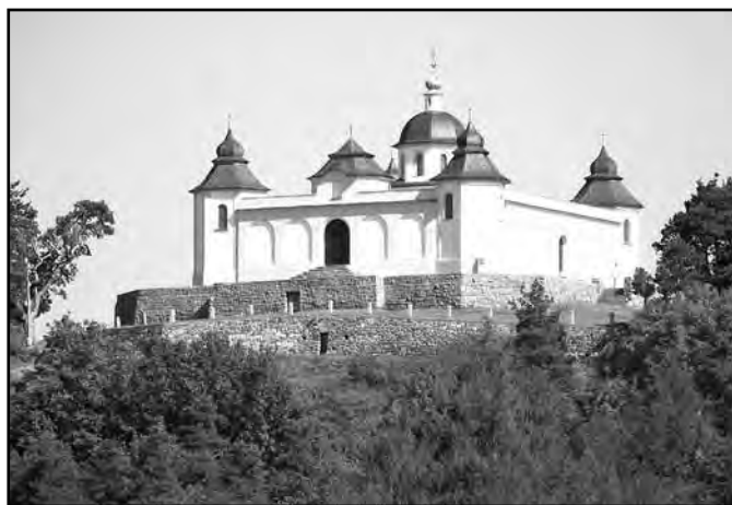
Kaple Anděla Strážce nad Sušicí.

Výraznou dominantou Sušice je vrch Stráž s kaplí Anděla Strážce. K tomuto krásnému raně baroknímu kostelíku můžete mimo jiné vystoupat i po tzv. Křížové cestě vybudované v roce 2010. Kaple je oblíbeným vyhlídkovým místem, které nabízí krásný výhled na město a řeku Otavu.