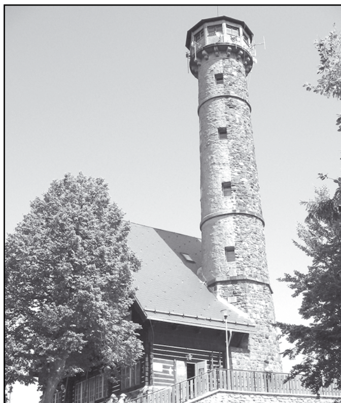
Rozhledna na vrchu Svatobor.

Poblíž centra leží velký sportovní areál, ve kterém najdete atletický stadion včetně sektorů s tartanovým povrchem, fotbalový stadion s jedním travnatým hřištěm a jedním hřištěm s UMT 3. generace, zimní stadion s celoročním provozem (od září do března je k dispozici ledová plocha, od dubna do srpna umělý povrch) a umělou horolezeckou stěnou, volejbalové a tenisové kurty. Všechna tato sportoviště je možné si po domluvě s provozovatelem pronajmout.