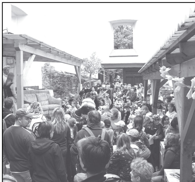
Z akcí na klatovské Hůrce.

duje sezení příznivců historie v restauraci U Radů v Klatovech. Pravidelně každý měsíc pořádáme vlastivědné výlety a vycházky do blízkého i vzdálenějšího okolí Klatov. Chodíme pěšky, jezdíme osobními auty, vlakem i zájezdním autobusem. Zváni jsou všichni zájemci.